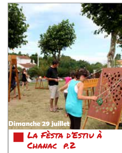
Dimanche 29 juillet