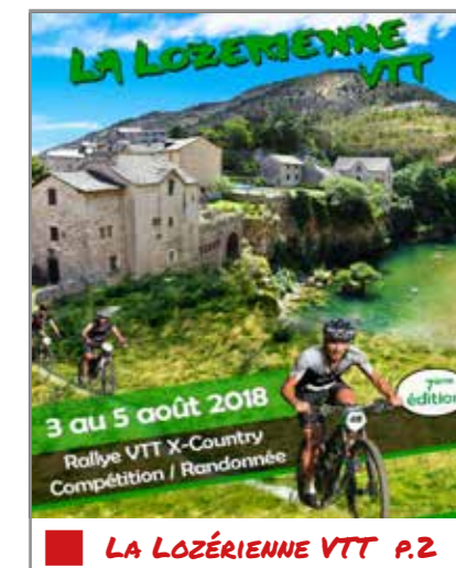
LA LOZÉRIENNE VTT P.2