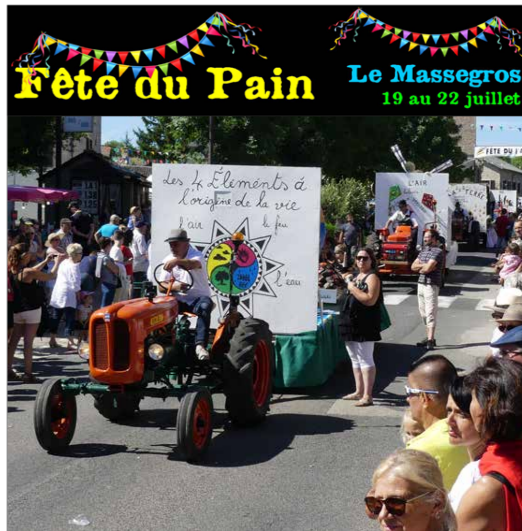
LA FÊTE DU PAIN AU MASSEGROS, UN INCONTOURNABLE ! P.2

Réalisée par l'Office de Tourisme de l'Aubrac aux Gorges du Tarn